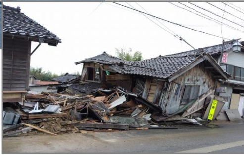
令和6年能登半島地震による住宅被害