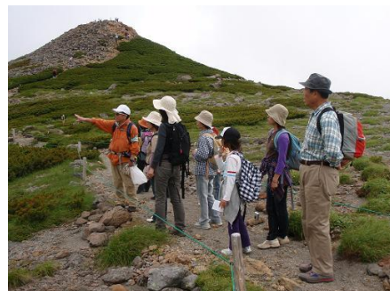
第4回<乗鞍岳で観察>