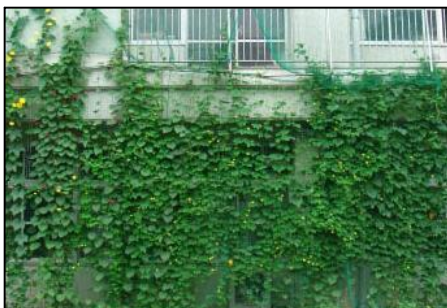
(横浜市内の学校の緑のカーテン)